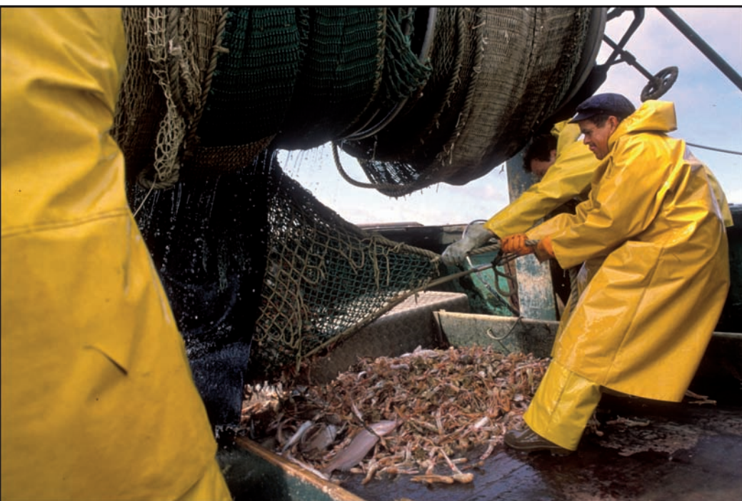
Le Guilvinec (29), pêche à la langoustine dans le golfe de Penmarch, à bord du Philippe-Martine , 6 juillet 1988.