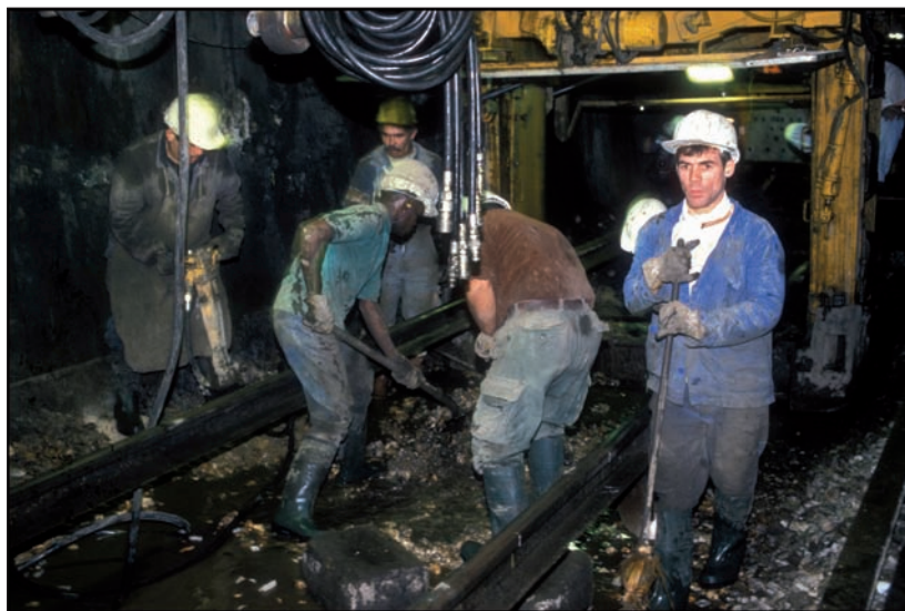
28 octobre 1999, Paris, RATP, réfection des voies la nuit sur la ligne 9.