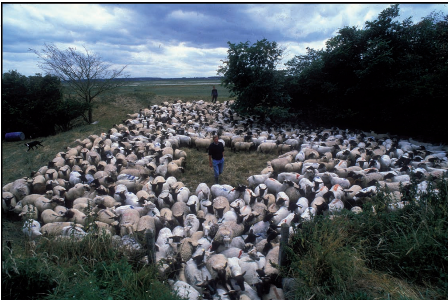
Élevage de moutons de pré-salé à Morlay, en baie de Somme, 28 juin 1999.