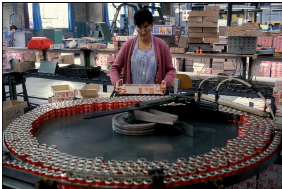
L'usine Wonder de Lisieux en 1985.