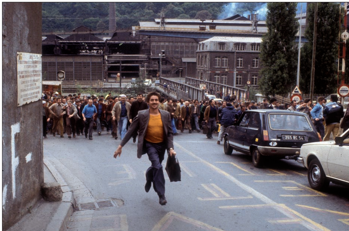
Sortie de l'usine Usinor, à Longwy, le 2 juillet 1979.