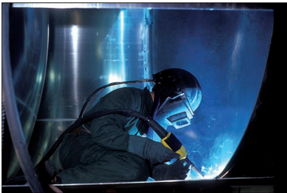
21 mars 1991, Lunéville, usine de fabrication de remorques PL Trailor.