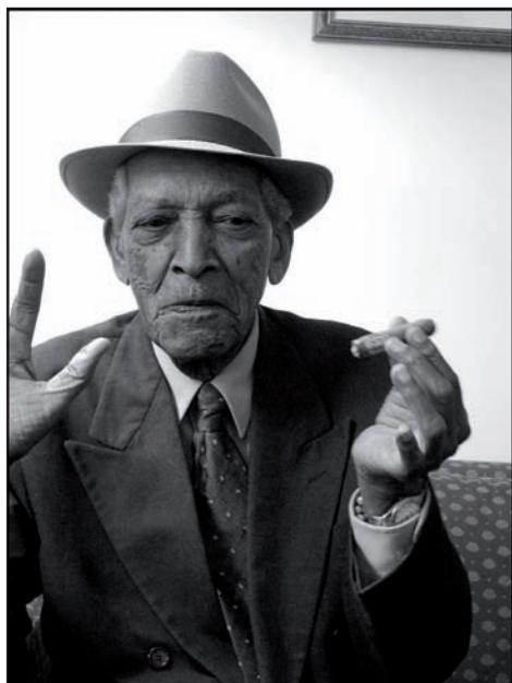
Compay Segundo, musicien cubain, 2001.