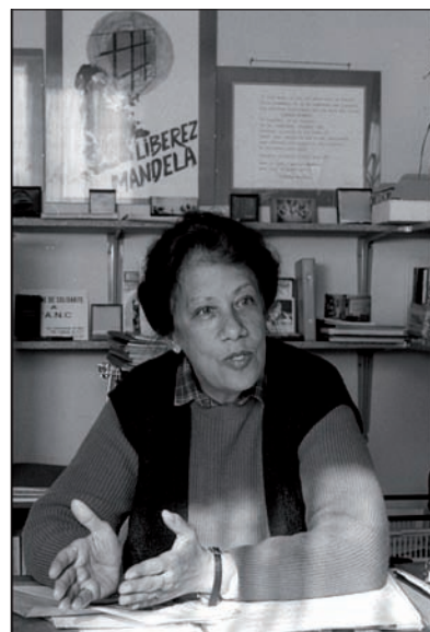
Portrait de Dulcie September (ANC) lors d'une interview pour la NVO , quinze jours avant son assassinat à Paris le 29 mars 1988.