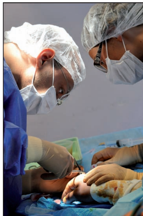
Grenoble, CHU, service des urgences médicales et chirurgicales, 26 juillet 2008.