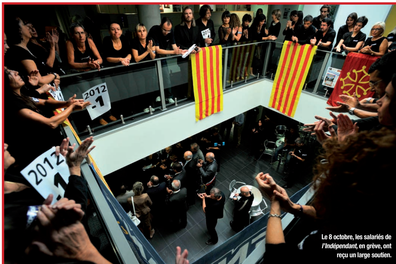
Le 8 octobre, les salariés de 'l'Indép' , en grève, ont reçu un large soutien.

Les salariés du groupe Journaux du Midi vont subir un lourd plan de suppressions de postes. La réaction a été particulièrement forte à 'l'Indép' , basé à Perpignan.