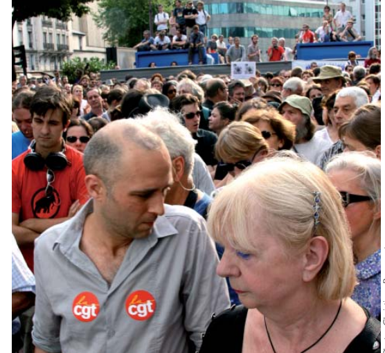
Le 1 er juillet dernier, devant la Maison de la radio à Paris.

deux heures en fin d'après-midi. Soutenu par l'intersyndicale de Radio France (CFDT, CFTC, CGT, SNJ, Sud), un « appel pour une radio publique indépendante » a été lancé 1 pour refuser « la main mise du pouvoir en place sur les antennes de la radio publique ». Rappelons qu'au printemps 2009, Jean-Luc Hees était le premier dirigeant de l'audiovisuel public directement nommé par Nicolas Sarkozy. Cet appel a donné lieu à une pétition (toujours en cours) et à des rassemblements de protestation, auxquels étaient invités les auditeurs, devant