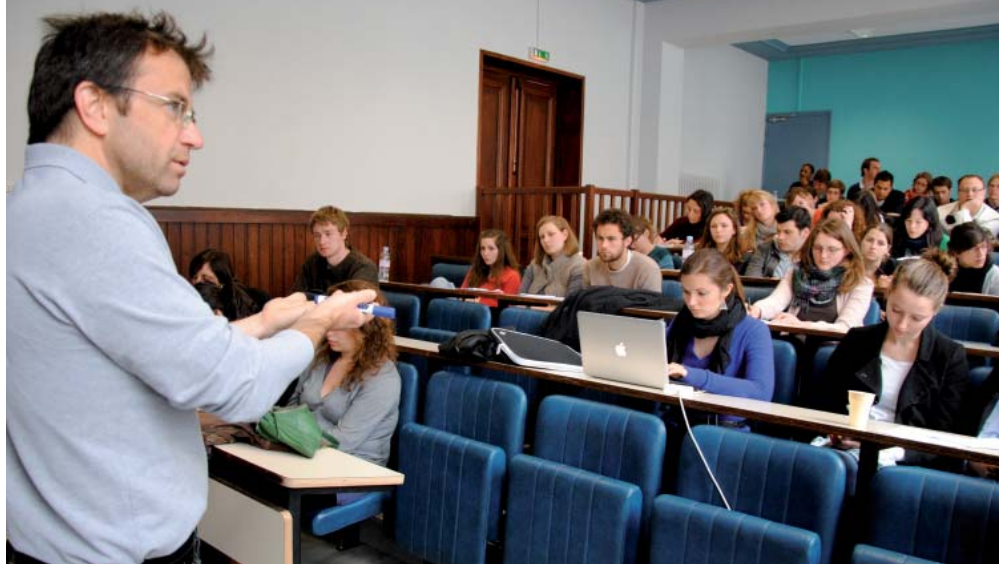
Début mai, à l'ESJ de Lille, quelques semaines avant que ces étudiants débutent dans le métier.

► Même pour de futurs professionnels, la carte de journaliste recèle des mystères. Reportage à l'ESJ de Lille.