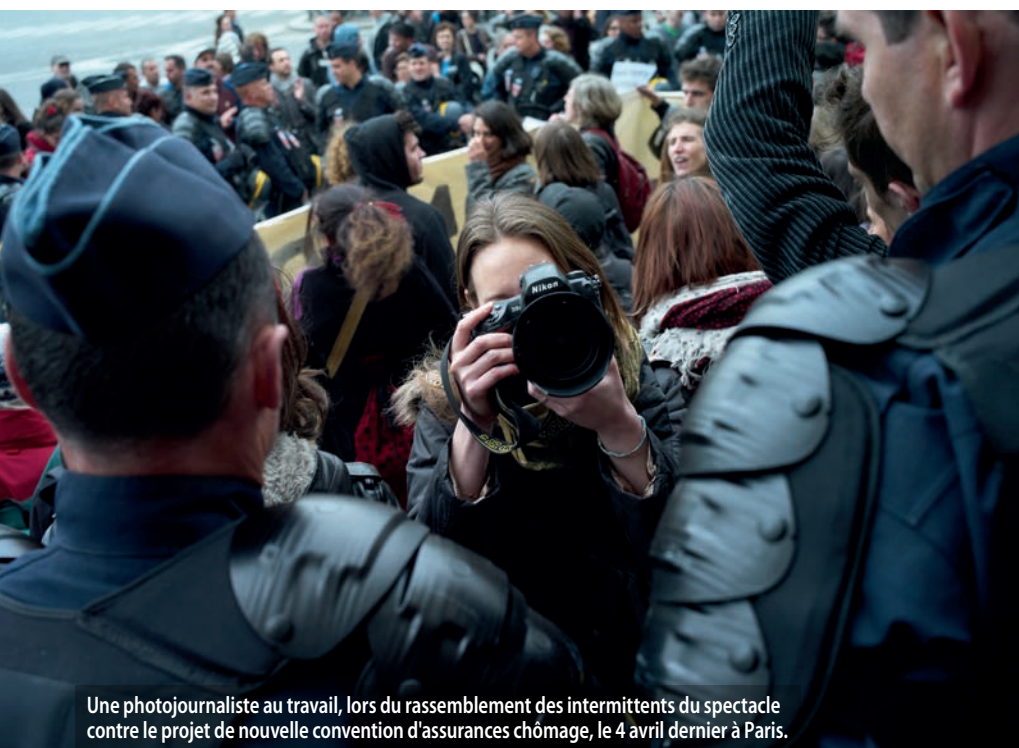
Une photojournaliste au travail, lors du rassemblement des intermittents du spectacle contre le projet de nouvelle convention d'assurances chômage, le 4 avril dernier à Paris.

(1) Article L.132-45 du Code de la propriété intellectuelle.