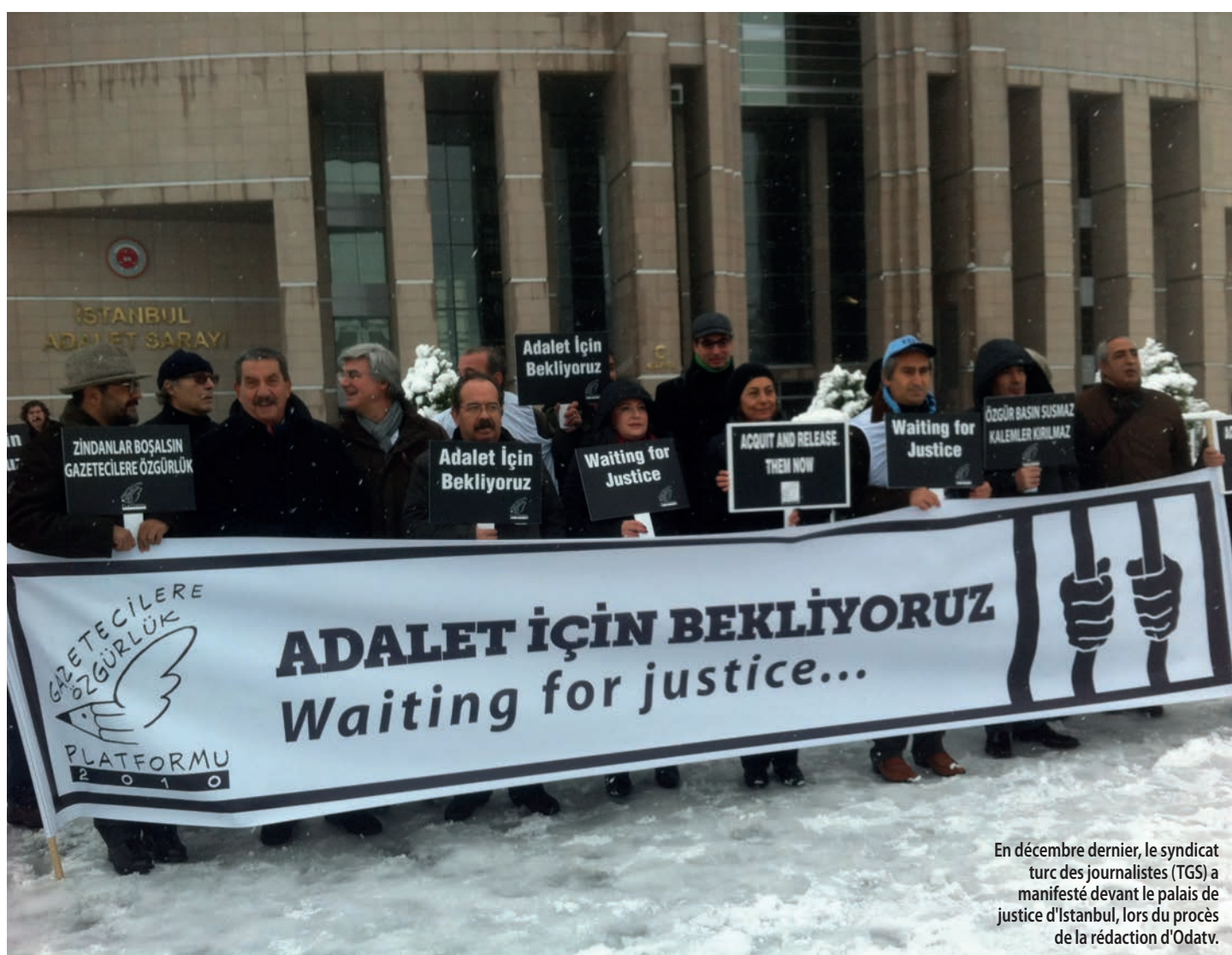
En décembre dernier, le syndicat turc des journalistes (TGS) a manifesté devant le palais de justice d'Istanbul, lors du procès de la rédaction d'Odatv.

La situation de la presse en Turquie s'est à nouveau dégradée début février avec le vote d'une loi liberticide renforçant le contrôle d'internet par le gouvernement, qui maintient toujours 59 journalistes derrière les barreaux.