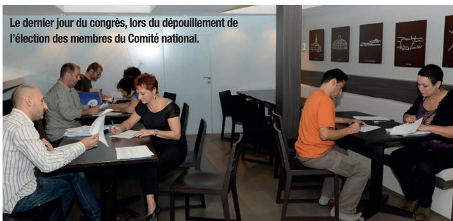
Le dernier jour du congrès, lors du dépouillement de l'élection des membres du Comité national.

O n n'a pas fini de mesurer l'ampleur des dégâts de ces deux bouleversements. D'une part, l'introduction dans la loi Hadopi d'une notion de « famille cohérente de presse ». D'autre part, l'amendement du député UMP Christian Kert, qui modifie le code du travail en disposant que la « collaboration entre une entreprise de presse et un journaliste professionnel porte sur l'ensemble des supports du titre de presse [...], sauf stipulation contraire dans le contrat de travail ou dans toute autre convention de collaboration ponctuelle ». « Jusque-là le contrat de travail du journaliste portait, dans la plupart des organes de presse, sur un seul titre », rappelle le document d'orientation. Le SNJ-CGT liste ensuite les « nombreuses régressions » à l'encontre des droits d'auteur des journalistes qui ont suivi, dont « la cession à titre exclusif à l'employeur des droits d'exploitation des œuvres » ou encore « la prise en compte dans le seul salaire de toutes les réutilisations d'œuvres, sur tout support du titre, pendant une période de référence négociée ». « Les droits d'auteur deviennent indissociables des questions de la nécessaire indépendance du journaliste, de son travail en conscience et de ses conditions de travail, comme de l'indépendance des titres et du pluralisme », insiste le SNJ-CGT, qui appelle à organiser « les résistances [...] dans toutes les rédactions », citant en exemple deux « bons accords », signés « à l'AFP et à France Télévisions ».