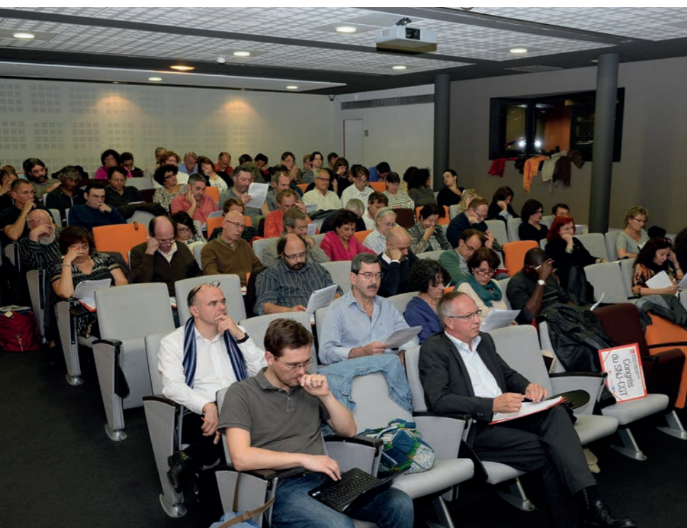
Les débats du congrès ont eu lieu à la Maison de la Région, installée le long de la célèbre Canebière.

par un financement de l'État, doit être pilotée par une instance de régulation et de gouvernance composée à tiers par les éditeurs, l'État et les représentants des salariés ». Autre revendication portée par le document d'orientation : « Les agrégateurs de contenus numériques (Google par exemple), qui soustraient à leurs seuls profits les recettes publicitaires liées aux contenus journalistiques de la presse écrite, doivent être assujettis à une taxe fiscale annuelle proportionnelle au chiffre d'affaires au bénéfice du développement de la presse et de sa distribution. »