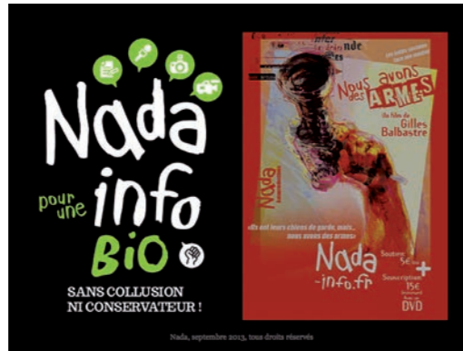
Gilles Balbastre, coréalisateur des « Nouveaux chiens de garde », a projeté aux congressistes un extrait de son prochain documentaire, sur le traitement médiatique des conflits sociaux. Pour préfinancer ses projets, il a créé la plate-forme nada-info.fr

fusés montrent des manifestants, dans les rues de Lille, réagissant au traitement médiatique de certains conflits sociaux. On retiendra ainsi la morgue et le mépris exprimés par Jean-Pierre Elkabbach, interviewant sur le plateau