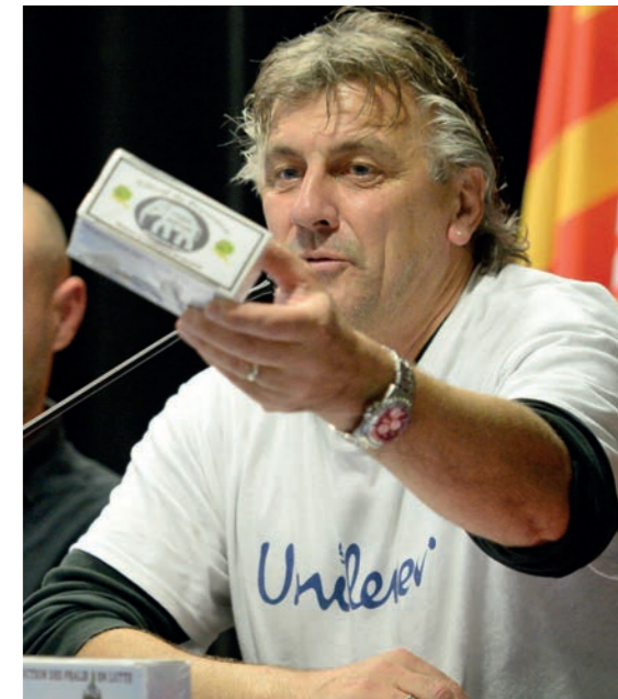
Les Fralib ont relancé une fabrication d'infusion à petite échelle, pour tester la faisabilité de leur projet.