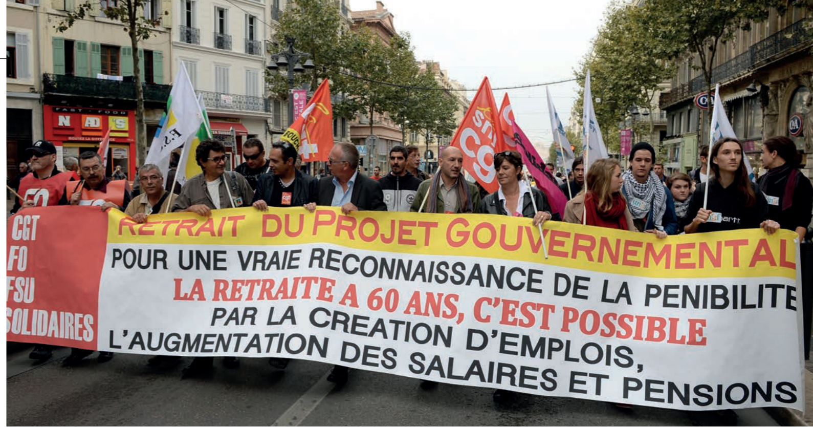
Pendant que les congressistes poursuivaient leurs débats, une délégation du SNJ-CGT s'est rendue à la manifestation pour la défense des retraites, mardi 15 octobre, dans les rues de Marseille. Ce jour-là, un appel national intersyndical avait été lancé par la CGT, FO, Solidaires et la FSU.