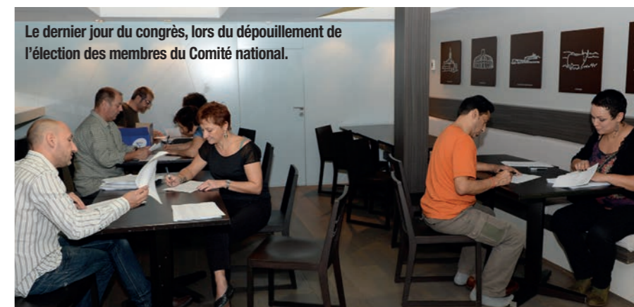
Le dernier jour du congrès, lors du dépouillement de l'élection des membres du Comité national.

O n n'a pas fini de mesurer l'ampleur des dégâts de ces deux bouleversements. D'une part, l'introduction dans la loi Hadopi d'une notion de « famille cohérente de presse ». D'autre part, l'amendement du député UMP Christian Kert, qui modifie le code du travail en disposant que la « collaboration entre une entreprise de presse et un journaliste professionnel porte sur l'ensemble des supports du titre de presse [...], sauf stipulation contraire dans le contrat de travail ou dans toute autre convention de collaboration ponctuelle ». « Jusque-là le contrat de travail du journaliste portait, dans la plupart des organes de presse, sur un seul titre », rappelle le document d'orientation. Le SNJ-CGT liste ensuite les « nombreuses régressions » à l'encontre des droits d'auteur des journalistes qui ont suivi, dont « la cession à titre exclusif à l'employeur des droits d'exploitation des œuvres » ou encore « la prise en compte dans le seul salaire de toutes les réutilisations d'œuvres, sur tout support du titre, pendant une période de référence négociée ». « Les droits d'auteur deviennent indissociables des questions de la nécessaire indépendance du journaliste, de son travail en conscience et de ses conditions de travail, comme de l'indépendance des titres et du pluralisme », insiste le SNJ-CGT, qui appelle à organiser « les résistances [...] dans toutes les rédactions », citant en exemple deux « bons accords », signés « à l'AFP et à France Télévisions ».