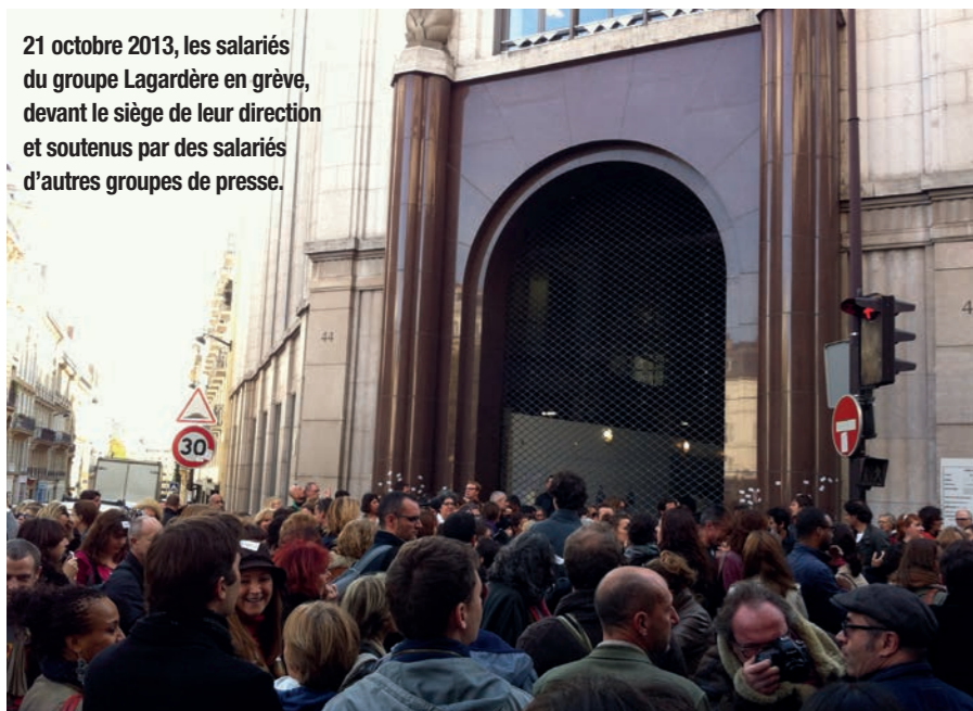
21 octobre 2013, les salariés du groupe Lagardère en grève, devant le siège de leur direction et soutenus par des salariés d'autres groupes de presse.