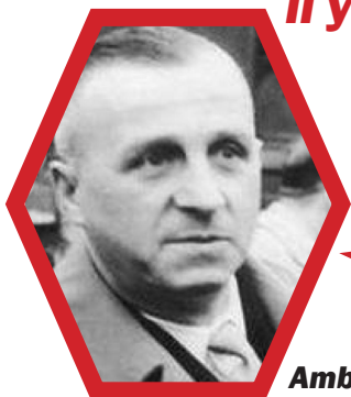
Ambroise Croizat ministre du Travail et de la Sécurité sociale entre 1945 et 1947

Si tout le monde partait à 60 ans, il y aurait des emplois pour les jeunes !