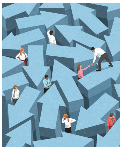
Illustration de John Holcroft Pour Edge magazine : « good leadership in business »

Un artiste et un portfolio à découvrir à tout prix ! http://www.johnholcroft.com/